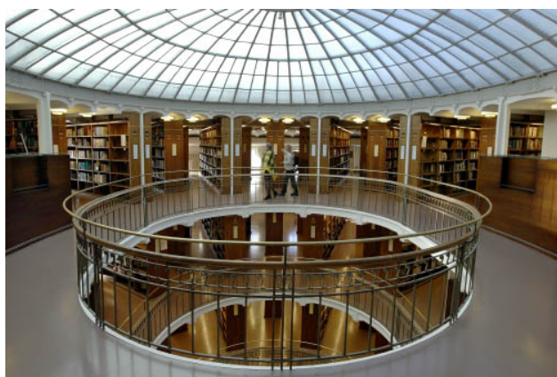
Rotunda ve Finské národní knihovně 3

po dosažení titulu bakaláře. Postgraduální programy, tzn. ty, které vedou k licenciátu a k doktorským titulům, jsou k dispozici studentům s vysokoškolskými diplomy.