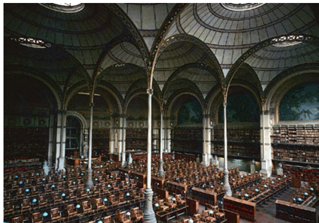
Knihovna Sorbonnské univerzity

Téměř 66 % absolventů s diplomy V. úrovně (CAP, BEP) je v zaměstnání. Míra zaměstnanosti držitelů titulu BTS se blíží 81 %.