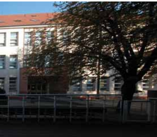
▲ Albertov, 17. listopadu 1989