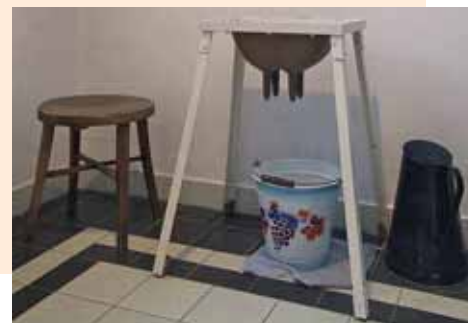
Výuková pomůcka na zemědělských školách

Teprve od roku 1958 bylo československé učňovské školství zase sjednoceno a převedeno pod řízení ministerstva školství. Díky tomu bylo zase zapojeno do celoškolské soustavy. Učební obory začínají znovu obsahovat širší teoretické vzdělávání odborné i všeobecné a jejich absolventi tak získávají možnost pokračovat ve studiu vyšších stupňů škol. Začíná se také prosazovat myšlenka, že by učitelé měli mít vysokoškolské vzdělání pedagogického zaměření.